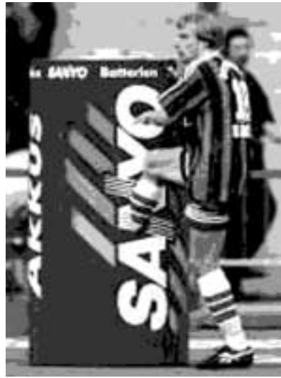
Aggro-Klinsmanns Kabinenfascismus: „Und schon gar nicht von Polen!“

ländern unterwegs, im Sommer 2006. SCHNITT. Herbst und Winter haben den Sommer längst abgelöst. Ein kompletter Amateure-Spieltag in Ostdeutschland wurde abgesagt wegen der braunen Dumpschädel. Deutschland 2007, Krawalle, fremdenfeindliche Pöbeleien und Gewalt füllen wieder die Zeitungsseiten. Deutschland, (m)ein Sommermärchen, schon ausgeträumt? Es war einmal? Lassen wir wenigstens DIESES Märchen anders enden! Fabius